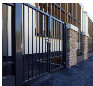
PORTAIL DOUBLE VANTAUX