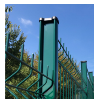
Poteau H alu 155