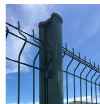
Poteau H alu 250