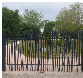
PORTAIL DOUBLE VANTAUX