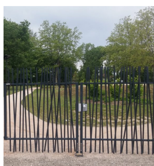
PORTAIL DOUBLE VANTAUX