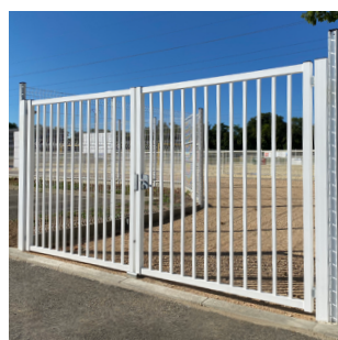
PORTAIL DOUBLE VANTAUX