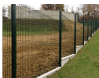
Montage en redan