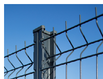
Poteau H à encoches