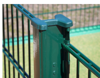
Poteau H alu 155**