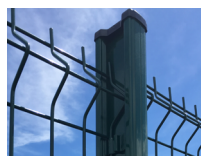
Poteau H alu 250