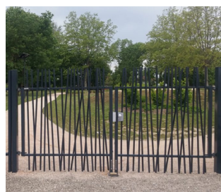
PORTAIL DOUBLE VANTAUX