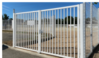
PORTAIL DOUBLE VANTAUX