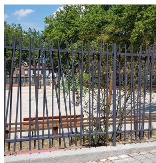
PORTAIL DOUBLE VANTAUX